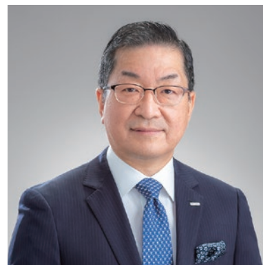
ポッカサッポロフード&ビバレッジ株式会社 代表取締役社長